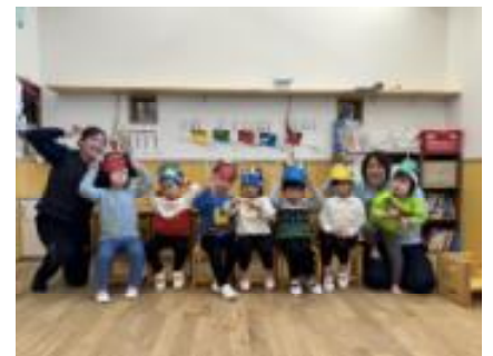
おにのお面をつくったよ 😊

「子どもは元気だから通わせたい」と思われる保護者の方もいらっしゃることでしょう。多くのお子さんがご利用いただく事業所としては大変複雑な気持ちですが、保護者の皆様には何卒その旨ご理解いただけますようお願いいたします。