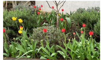
駐車場のチューリップが咲きました