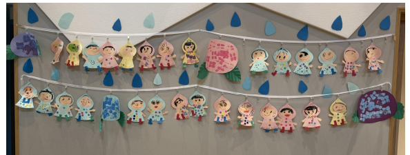
きりん組の作品(梅雨)